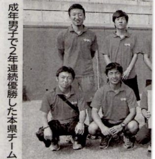
成年男子で2年連続優勝した本県チーム (中大4年)の兄弟がた、南郷周と組んだ測量設計は「ペアくだった。誰と組もうに準備してきた。前衛の国体代表はいない。目の前で仲を見せられ、泉山おのプレーをしなきゃね」と尻に火が付いた。

▽少年女子リーグ戦順位 ①宮城5勝2敗②岩手3勝2敗③山形3勝2敗④青森2勝3敗⑤福島1勝4敗⑥秋田1勝4敗 (宮城、岩手出場。2、3対戦成績による)